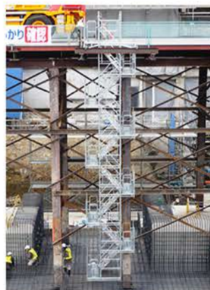
クレーンでの設置状況 (S社JV 京都府・蹴上浄水場)